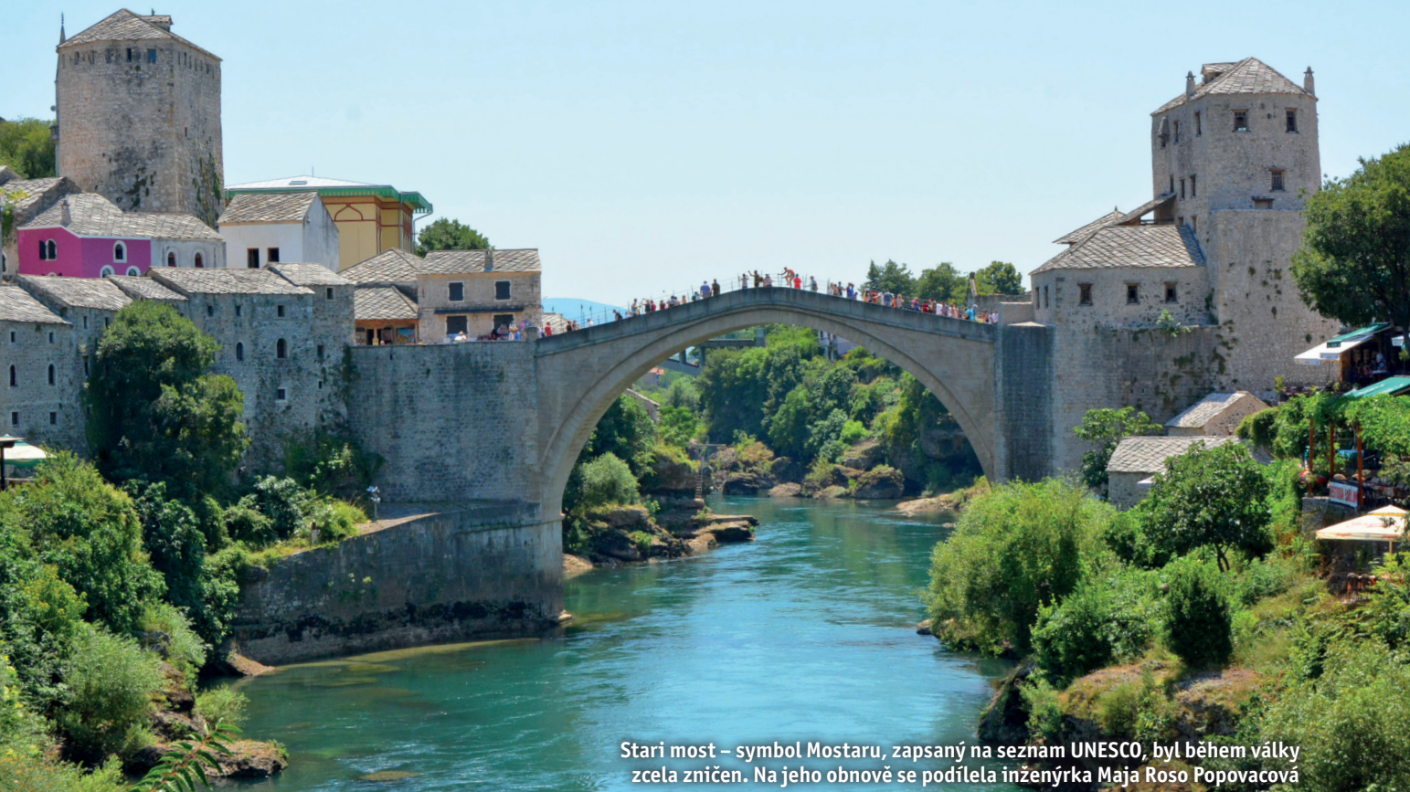
Stari most – symbol Mostaru, zapsaný na seznam UNESCO, byl během války zcela zničen. Na jeho obnově se podílela inženýrka Maja Roso Popovacová