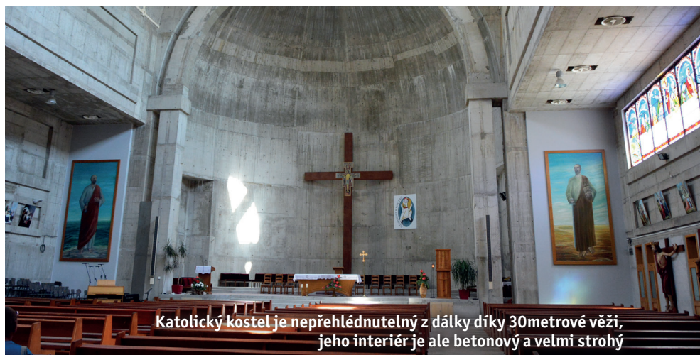
Katolický kostel je nepřehlédnutelný z dálky díky 30metrové věži, jeho interiér je ale betonový a velmi strohý

Mostar je město v Bosně a Hercegovině, založené jako správní centrum sandžaku Hercegovina za dob vlády Osmanské říše v roce 1522. Jeho název pochází od místního světoznámého mostu přes řeku Neretvu, který byl vystavěn v roce 1566 a spojoval muslimskou část města s chorvatskou. Původní Stari most, který byl památkou UNESCO, byl zničen 9. listopadu 1993 během občanské války střelbou bosenských Chorvatů. Po rekonstrukci, která proběhla přesně podle postupů používaných v Osmanské říši, byl v roce 2005 opět zapsán na Seznam světového dědictví UNESCO. Most je známý nejen jako architektonicky cenná památka, ale také díky „skokům dospělosti“, tradici pocházející již ze 17. století, která spočívá ve skocích chlapců z 24 metrů vysokého mostu do Neretvy. Mostar je dnes se 105 000 obyvateli pátým největším městem v zemi.