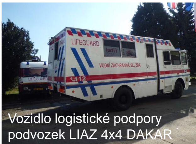
Odřad VZS Jihomoravského kraje