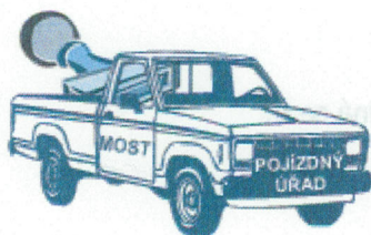
logo Pojízdného úřadu Magistrátu města Mostu

Jak je služba pojízdného úřadu zajišťována: