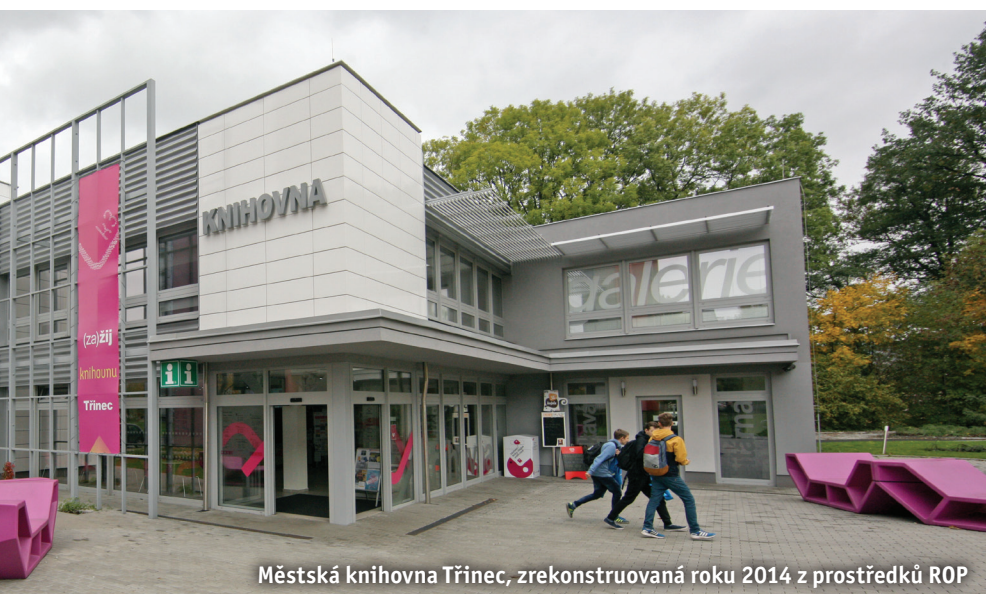
Městská knihovna Třinec, zrekonstruovaná roku 2014 z prostředků ROP