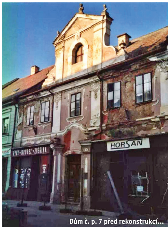
Dům č. p. 7 před rekonstrukcí...