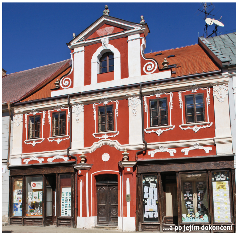
...a po jejím dokončení