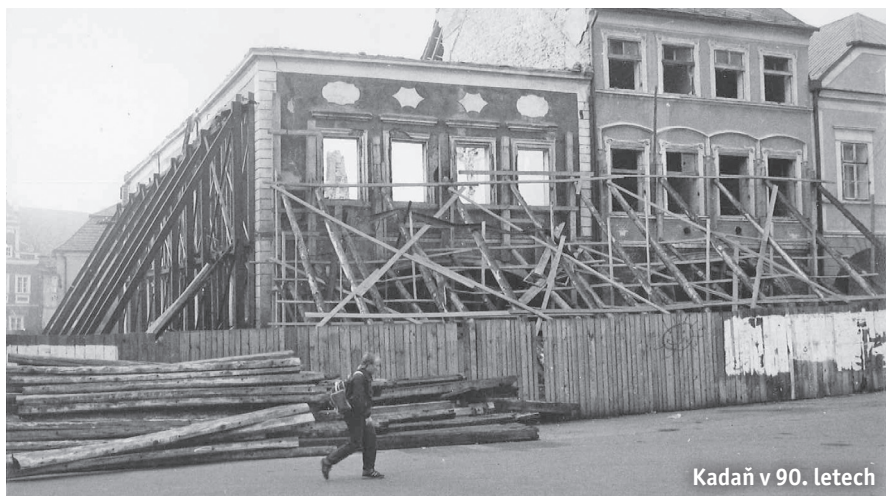
Kadaň v 90. letech

Město věnuje regeneraci památkové rezervace maximální pozornost.