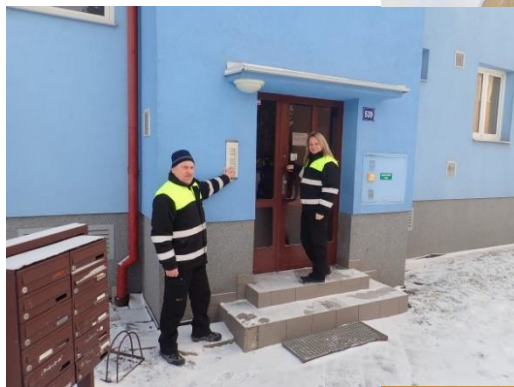
Obrázek č. 2: Domovníci-preventisté města Valašské Meziříčí