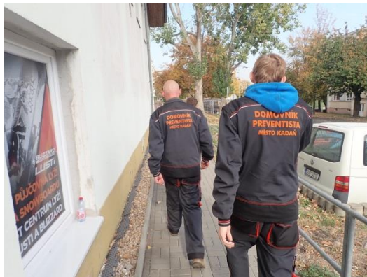
Obrázek č. 1: Domovníci-preventisté města Kadaň

„Domovník - preventista“, včetně ukázky příkladů dobré praxe z některých měst, které se již projektu „Domovník - preventista“ v letech 2018-2020 zúčastnila.