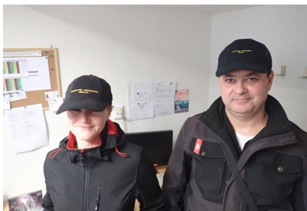
Obrázek č. 6: Domovníci-preventisté města Břeclav

souladu s místními předpoklady a s místními zvyklostmi, o vytváření podmínek pro rozvoj sociální péče a pro uspokojování potřeb svých občanů. Jde především o uspokojování potřeby