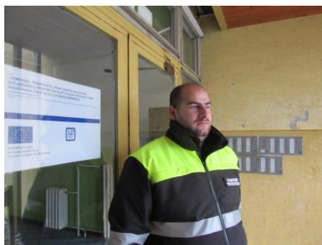
Obrázek č. 8 a 9: Domovník-preventista města Břeclav (vlevo) a Valašské Meziříčí