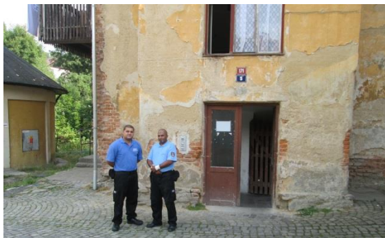
Obrázek č. 5: Asistenti prevence kriminality města Vimperk v projektu APK II. rok 2015

Asistenti prevence kriminality nenásilně působí v příslušných rizikových nebo sociálně vyloučených lokalitách za účelem omezení narušování veřejného pořádku, občanského soužití a s cílem