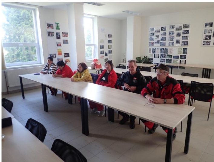
Obrázek č. 4: Domovníci-preventisté města Rotava

Jak již bylo výše napsáno, primární odpovědnost za zabezpečování místních záležitostí veřejného pořádku má obec, která zodpovídá za záležitosti ochrany veřejného pořádku ve svém obvodu. Povinnosti k tomuto zajištění, může obec ukládat v samostatné působnosti obecně závaznou vyhláškou k zabezpečení místních záležitostí veřejného pořádku, kdy může zejména stanovit, které činnosti, jež by mohly narušit veřejný