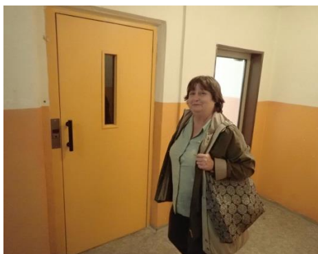
Obrázek č. 13: Domovník-preventista města Kladno

Je tedy zřejmé, že zaměstnáním potřebného množství domovníků-preventistů do bytových domů/ubytoven, která jsou v majetku obce/města, obec získá pracovníka/pracovníky, kteří budou najednou dohlížet a řešit řadu obtíží a problémů, na které obec/město doposud nemělo pracovní kapacity a mnohdy je ani nestačilo, nebo dokonce odmítalo, z důvodu nerentabilnosti, řešit.