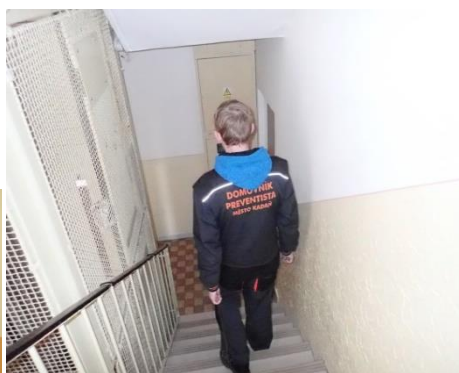
Obrázek č. 14: Domovník-preventista města Kadaň