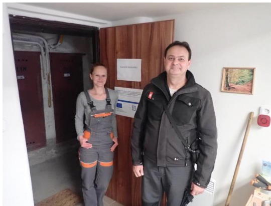
Obrázek č. 7: Domovníci-preventisté města Břeclav

Domovník-preventista tedy díky této činnosti koordinuje a vyžaduje dodržování bezpečnostních opatření v bytovém domě/ubytovně a jeho nejbližším okolí a je také schopen provádět efektivní dozor nad správným používáním společných prostor budov.