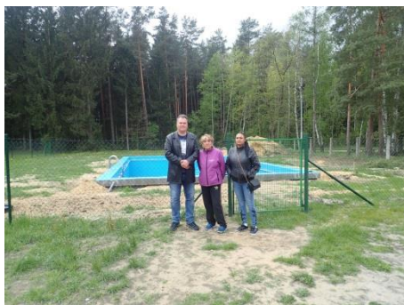
Obrázek č. 12: Domovníci-preventisté města Ralsko s lektorem