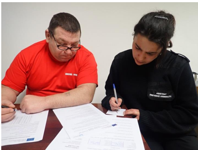
Obrázek č. 16: Domovník-preventista a asistent prevence kriminality města Žďár nad Sázavou

Pokud se realizační tým zamyslí nad možnými, zde uvedenými a samozřejmě i dalšími možnými (zde neuvedenými) problémy a obtížemi, pak bude zahájení a průběh celé realizace projektu jednodušší, pro všechny zábavnější a zejména pak bezproblémové.