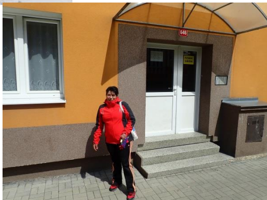
Obrázek č. 3: Domovník-preventista města Rotava