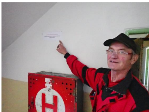
Obrázek č. 7: Domovník-preventista města Rotava

Domovník-preventista je tedy skutečným preventistou, který musí znát základní pojmy a zásady prevence kriminality, musí zásady prevence