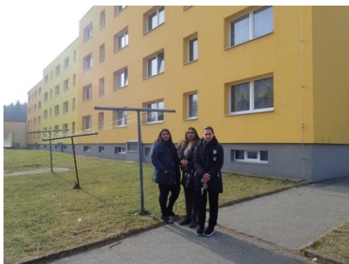
Obrázek č. 6: Domovníci-preventisté města Ralsko