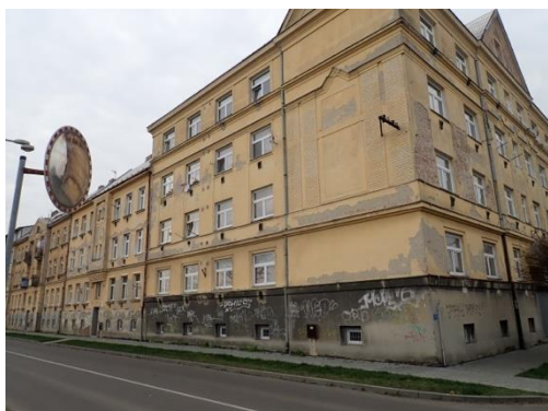
Obrázek č. 2: Bytový dům města Brno

Ubytovnou rozumíme stavbu ubytovacího zařízení nebo její část, kde je poskytováno ubytování a služby s tím spojené. Tato kategorie bydlení patří mezi ostatní ubytovací zařízení, kterými jsou zejména ubytovny, koleje, svobodárny, internáty, kempy a skupiny chat nebo