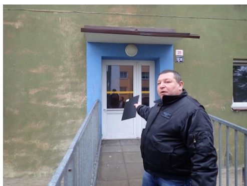
Obrázek č. 9: Domovník-preventista města Žďár nad Sázavou

V této rozsáhlé kapitole se čtenář dozvěděl podrobné informace o teoretickém i skutečném obsahu práce domovníka-preventisty. Jak je vidět, náplň práce domovníka-preventisty, který ji chce skutečně dělat