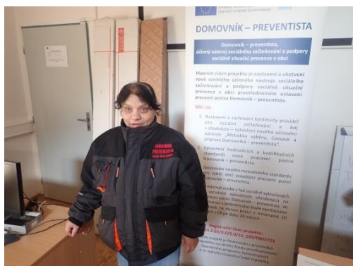
Obrázek č. 13: Domovník-preventista města Nový Bydžov

Součástí každého úvodního a průběžného vzdělávání domovníků-preventistů může být i krátké přezkušování z témat, které tvořily obsah úvodního nebo průběžného vzdělávání. Přezkušování může být písemné pomocí příslušného testu, nebo ústní pomocí jednoduchých otázek.