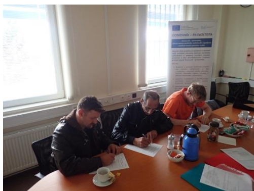
Obrázek č. 12: Domovníci-preventisté města Kadaň