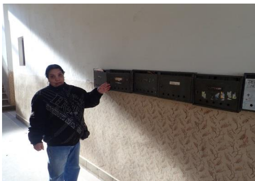
Obrázek č. 5: Domovník-preventista města Nový Bydžov

Celý tento praktický zácvik, tedy všechny výše uvedené informace, jsou předávány domovníkovi-preventistovi převážně v rovině praktické přímo v bytových domech/ubytovnách a jejich