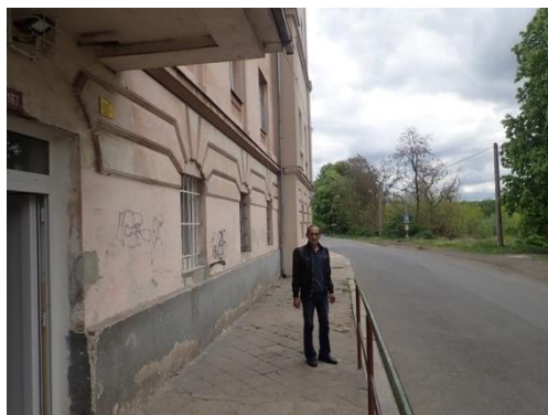
Obrázek č. 3: Domovník-preventista města Kadaň