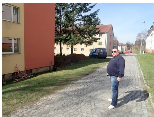
Obrázek č. 10: Domovník-preventista města Žďár nad Sázavou

Domovník-preventista, ač se to mnohým stále nezdá, je zaměstnání, které je velmi náročné. Jak již bylo nastíněno na konci minulé kapitoly, člověk pracující na této pozici musí ovládat komunikaci, musí mít základy etiky, musí se orientovat v právní normách a také musí zvládat konfliktní, nestandardní a mimořádné situace, orientovat se v příslušných právních předpisech, měl by zvládat odstraňování jednoduchých závad, měl by umět pracovat se svým stresem, umět poradit si v různých životních situacích atd. Výčet znalostí a dovedností domovníka-preventisty je samozřejmě daleko větší. Aby to vše domovník-preventista dokázal, musí podstoupit vzdělávání. Vzděláváním domovníků-preventistů rozumíme předávání všech dostupných teoretických informací a potřebných praktických dovedností a zkušeností, potřebných pro jejich práci a jejich ověřování. Proto musí být profesní příprava domovníků-preventistů vždy samozřejmostí. V tomto případě se nejedná ovšem jen o přímé předávání