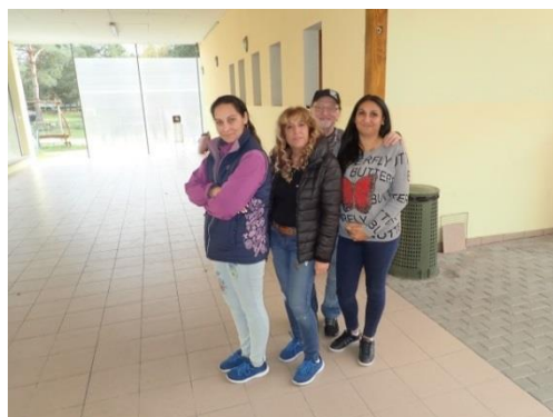
Obrázek č. 14: Domovníci-preventisté města Ralsko

Je samozřejmostí, že zkouška musí být jistou oficialitou. Zde je třeba zdůraznit, že by domovník-preventista k tomuto závěrečnému vzdělávání