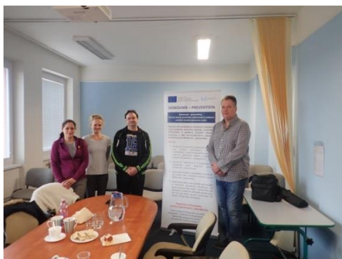
Obrázek č. 11: Domovníci-preventisté města Břeclav s lektorem

Vzdělávání domovníků-preventistů by měl vždy provádět tým zkušených odborníků nebo odborník s dostatečnou praxí v příslušném oboru, jako je