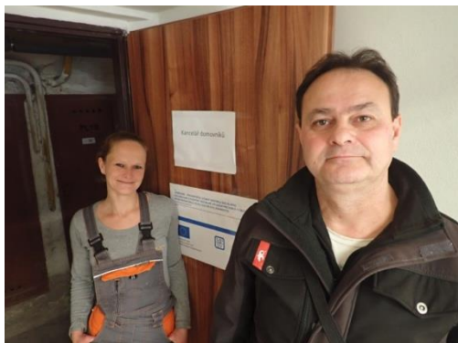
Obrázek č. 1: Domovníci-preventisté města Břeclav

Na tuto skutečnost, a na základě velmi dobrých výsledků projektu