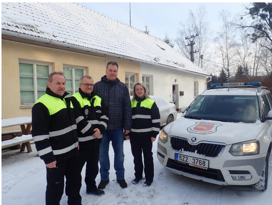
Obrázek č. 15: Strážník Městské policie Valašské Meziříčí s domovníky-preventisty a lektorem

pro své „město“ také vykonávat svou práci. Proto je na základě všech zkušeností vyplývajících z projektu „Domovník - preventista“ potřeba sladit vlastní práci a vzdělávání do jednoho celku a tím splnit kritérium vzdělávání a práce každého domovníka-preventisty.