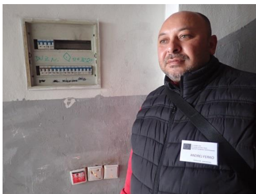
Obrázek č. 8: Domovník-preventista města Vysoké Mýto

příslušnou revizi – toto ovšem nelze brát jako jeho povinnost);