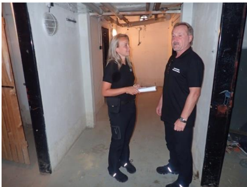
Obrázek č. 10: Domovníci-preventisté města Valašské Meziříčí

Jaký...může být následek mého (občanova) neplánovitého/nebezpečného jednání a chování.