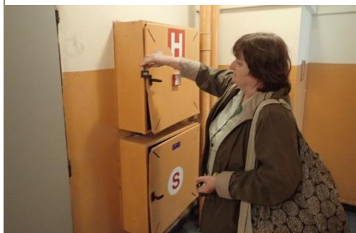
Obrázek č. 2: Domovník-preventista města Kladno

Při své preventivní činnosti domovník-preventista neustále hledá odpovědi na otázky: