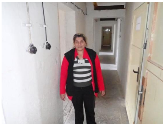
Obrázek č. 13: Domovník-preventista města Rotava

Domovník-preventista na základě svých komunikačních dovedností (do kterých patří nejen umění dobře mluvit, ale vědět, co chci říci, co říkám, zda umím naslouchat, umím posoudit překážky v komunikaci, zda jsem schopen získat komunikačního partnera, přesvědčit jej o výhodách spolupráce, vyjednat problém nebo zabránit konfliktu), je chopen velice efektivně řešit problémy vyskytující se v bytových domech/ubytovnách a v jejich okolí, a to zpravidla bez pomoci policie. Umění komunikace je mnohdy podceňováno, avšak ve skutečnosti tvoří podstatu práce každého domovníka-preventisty.