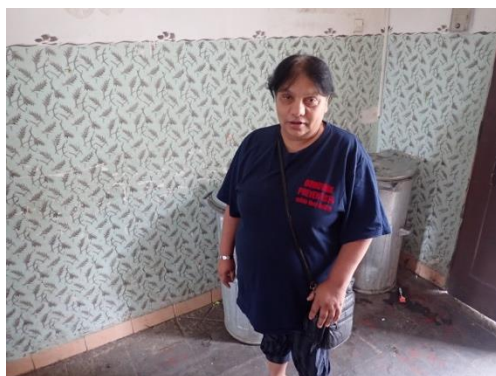
Obrázek č. 3: Domovník-preventista města Nový Bydžov