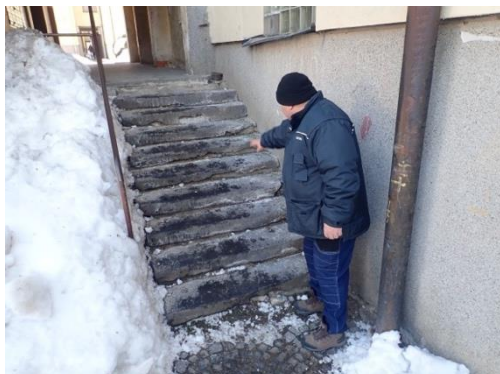
Obrázek č. 8: Domovník-preventista města Žďár nad Sázavou

Domovník-preventista musí vědět, co chce, co může, co umí!