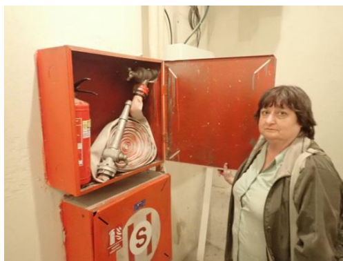
Obrázek č. 4: Domovník-preventista města Kladno

Jak z výše uvedeného textu vyplývá, kontrola dodržování zákazů v oblasti prevence požárů a provádění tzv. požární prevence s občany bytových domů je věcí velmi náročnou, avšak také potřebnou a měla by být zařazena nejen do praktického