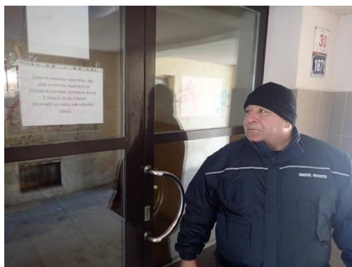
Obrázek č. 7: Domovník-preventista města Žďár nad Sázavou

Vytvoření bezpečnostní a hodnotové analýzy, byť se to nezdá, je velmi jednoduché a nezabere příliš mnoho času, pokud je zde přítomna místní a osobní znalost.