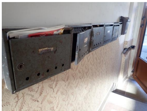
Obrázek č. 5: Bytový dům ve městě Nový Bydžov