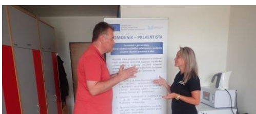
Obrázek č. 11 a 12: Domovníci-preventisté města Valašské Meziříčí (nahore s lektorem)

Důležitá je moc – tedy povědomí obyvatel bytových domů/ubytoven, že domovník-preventista může něco změnit a že za jeho práci stojí další silné skupiny – spolupracující subjekty, které mu pomohou při řešení konkrétních problémů.