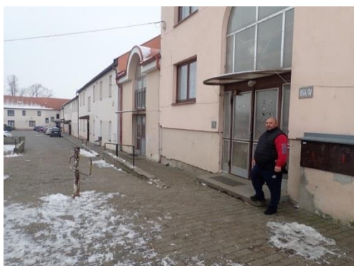
Obrázek č. 9: Domovník-preventista města Vysoké Mýto

Pozorování patří mezi základní preventivní techniky, které domovník-preventista provádí každý svůj pracovní den. Mnohdy se stane, že je domovník-preventista také přítomen protiprávnímu jednání cizí osoby, nebo se příslušné orgány snaží získat od domovníka-preventisty konkrétní informace o určité věci, nebo určité osobě na základě jejího popisu, fotografie, nebo videozáznamu, nebo je domovník-preventista