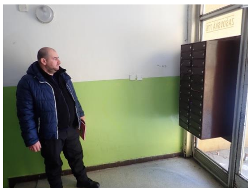
Obrázek č. 6: Domovník-preventista města Valašské Meziříčí

Nebezpečí, související přímo s prací domovníka-preventisty, pak lze chápat jako nebezpečí vyplývající zejména z nedodržování vlastní