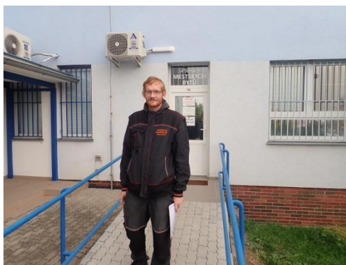
Obrázek č. 1: Domovník-preventista města Kadaň

Jelikož prevence patří mezi základní dovednosti každého domovníka-preventisty a její znalost je podmínkou dobré práce a dobrých výsledků práce každého preventisty, je jí v této příručce věnováno několik kapitol.