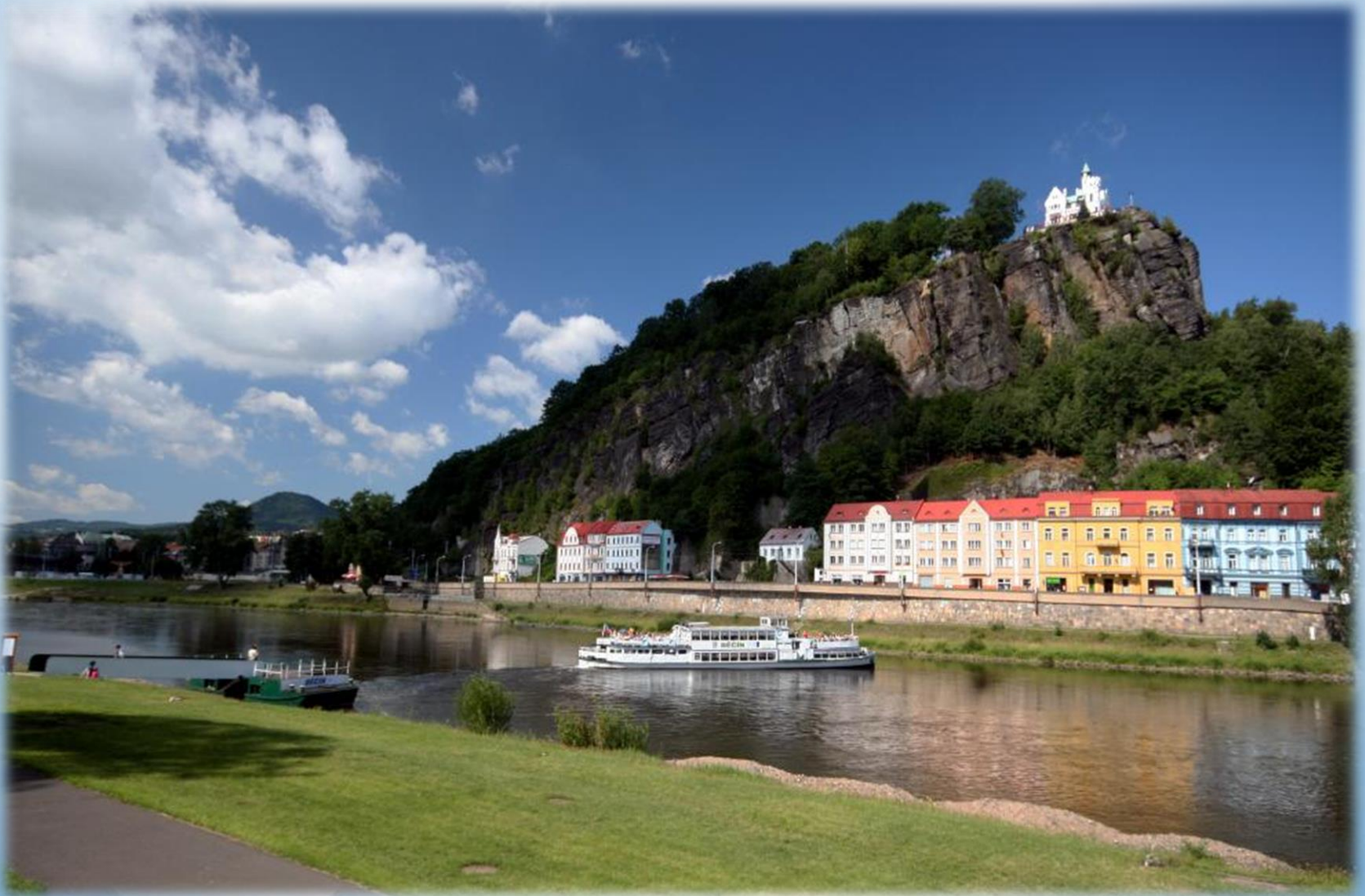
Labské nábreží a Pastýřská stěna