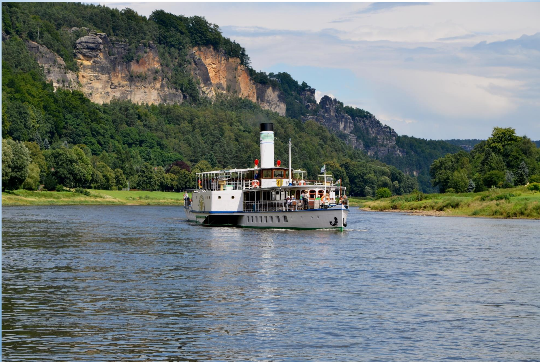
Kaňon řeky Labe u Rathen