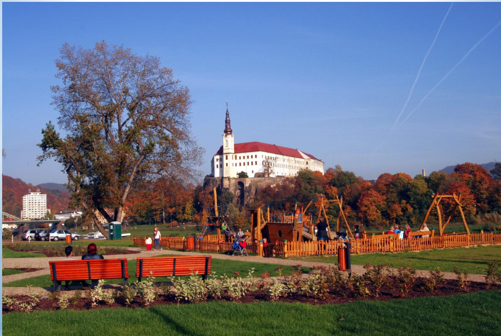
Děčínský zámek a dětské hřiště