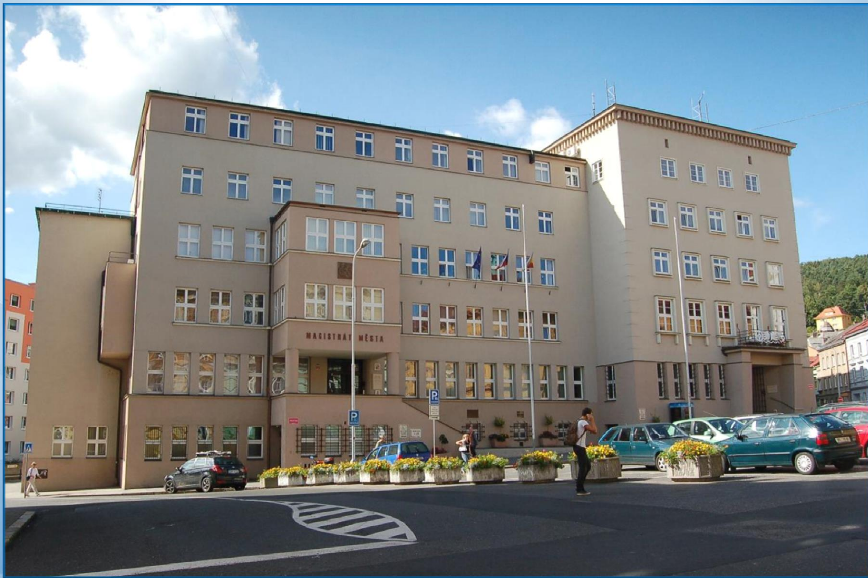
Budova Magistrátu města Děčín