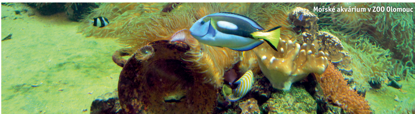
Mořské akvárium v ZOO Olomouc

„Rok 2015 byl dokončovacím rokem předchozího projektového období a přípravou na nové. Z tohoto ohledu jsme se v minulém roce spíše připravovali na budoucí kofinancování nových projektů. Pro letošní rok jsme investiční prostředky navýšili zhruba o 76 milionů, a to na 356 milionů korun,“ vyčíslil náklady primátor. „Situace je nyní taková, že zatímco v minulých letech se kladl důraz na vyčerpání prostředků z evropských fondů a investovalo se do větších staveb a projektů, běžná rekonstrukce a údržba infrastruktury zůstávala možná trochu upozaděna. Teď je tedy trend vyřešit tyto potřebné záležitosti,“ zdůrazňuje. A vzápětí upřesňuje, co město nejvíc v tomto směru pálí. „Asi největší chystanou investiční akcí je nyní rekonstrukce tramvajové trati na ulici 1. máje. A připravujeme už rekonstrukci navazující trati v ulici 8. května. Jako každé jiné město i Olomouc se potýká s nedostatkem parkovacích míst nejen na sídlišti, ale také v centru,“ konstatuje primátor.