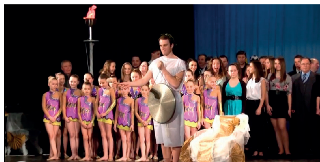
Zubří, Sportovní galavečer (6:22)