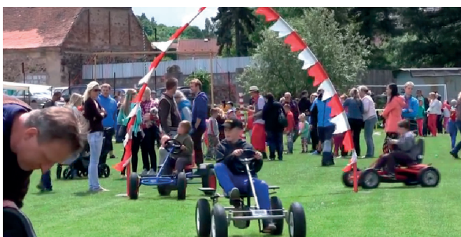
Hrobčice, Dětský den (6:57)

JIRÍ CHUM: Video by mohlo být celkově kratší, některým záběrům chybí logický začátek.