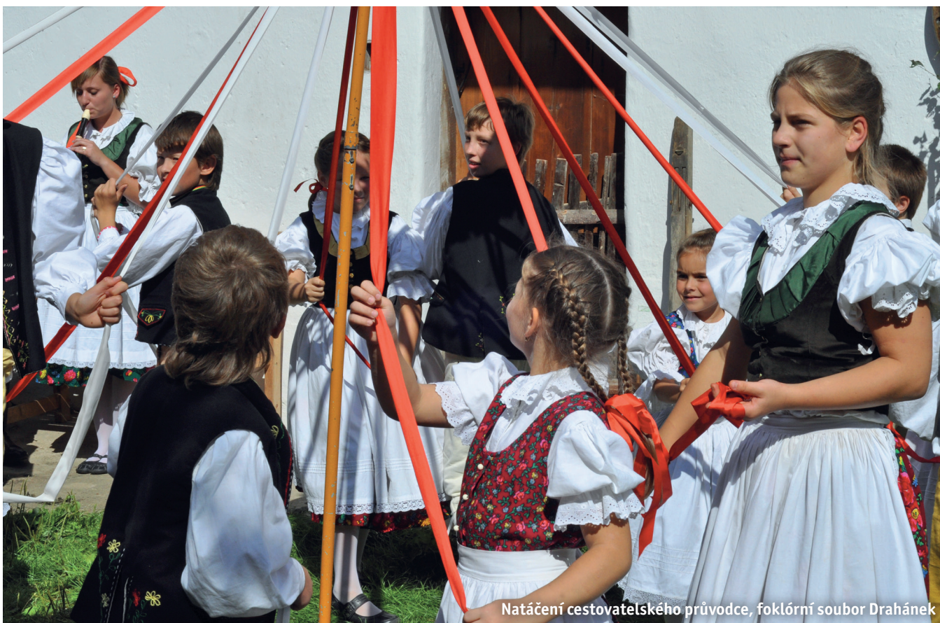
Natáčení cestovatelského průvodce, folklórní soubor Drahánek