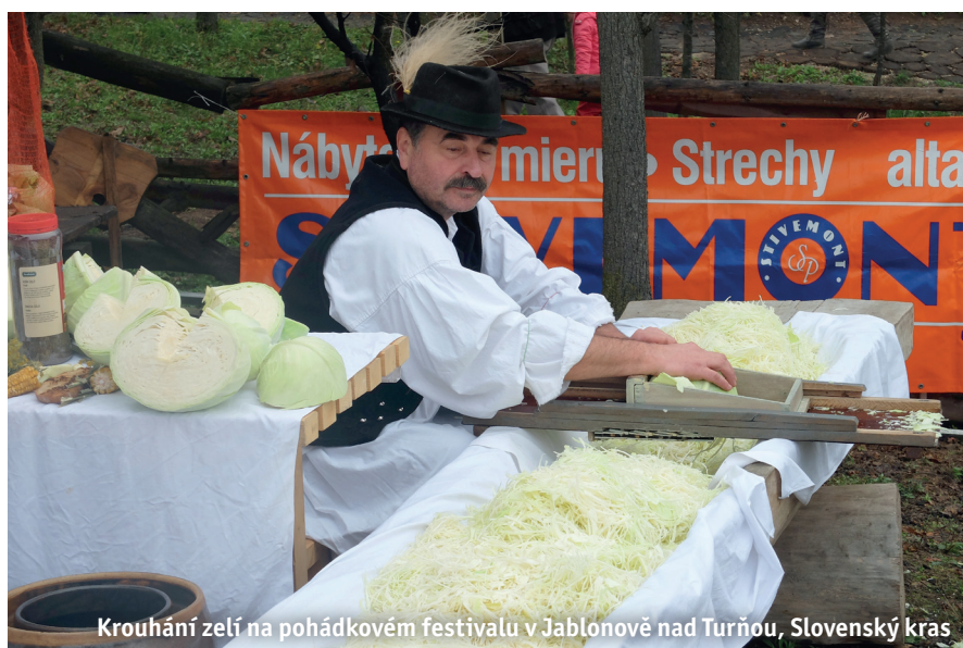
Krouhání zelí na pohádkovém festivalu v Jablonově nad Turňou, Slovenský kras

vých zastavěných území v souladu s myšlenkami udržitelného rozvoje. Čtvrť byla založena na místě bývalých francouzských kasáren v roce 1992 a dokončena v roce 2006, v současné době zde bydlí přes 5000 obyvatel. Projekt si kladl za cíl vybudovat modelovou čtvrť splňující vysoké ekologické, ekonomické kulturní a sociální standardy. Například všechny domy jsou postaveny minimálně jako nízkoenergetické (dosahují energetické spotřeby max. 65 kWh/m 2 ). Ve čtvrti se nachází „sluneční vesnice“ s 50 energeticky plusovými domy (produkují více energie, než spotřebují), široce rozšířené jsou instalace solárních článků a kolektorů (jejich použití je podporováno dotací). Hlavním zdrojem energie je centrální kotelna na dřevní štěpku (elektrina je zdrojem jen pro 10 % obyvatel),“ popisuje Jozef Jančo. „Německou zkušenost jsme se pokusili aplikovat v Řícmanicích a v Rájci-Jestřebí. Zastupitelstva přijala doporučení, která budou předávána stavebníkům spolu s územně-plánovacími informacemi, jejichž dodržení je