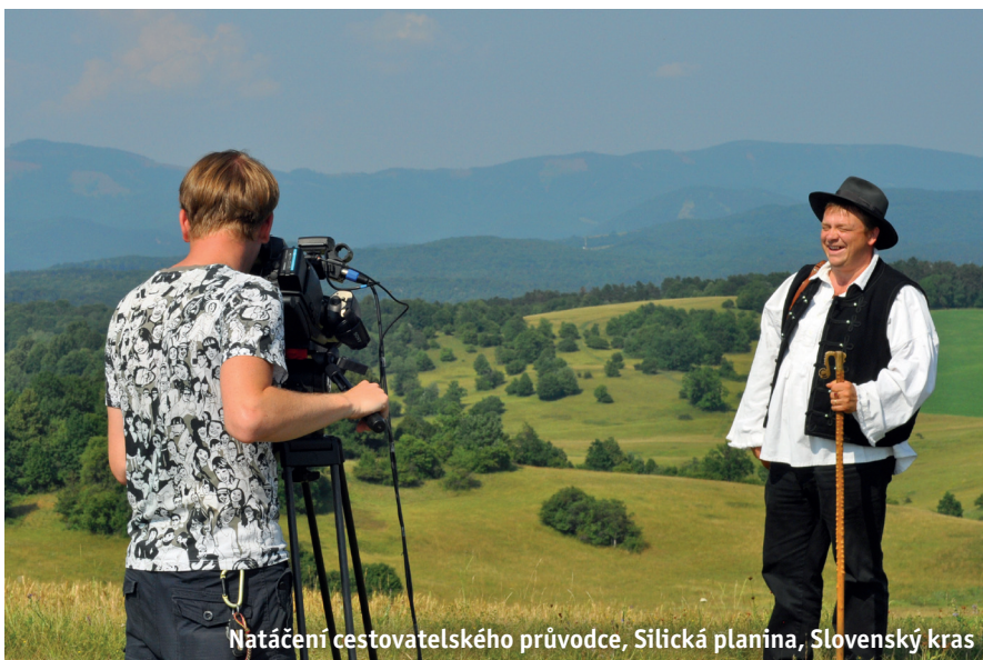
Natáčení cestovatelského průvodce, Silická planina, Slovenský kras