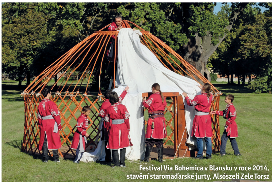
Festival Via Bohemica v Blansku v roce 2014, stavění staromaderské jurty, Alsószele Zele Torsz