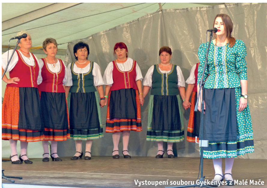
Vystoupení souboru Gyékényes z Malé Mače

MAS Moravský kras tedy během přechodného období nemusela zaměstnance propouštět, spíše dokonce naopak. „Této situace jsme dosáhli zapojením zaměstnanců MAS do projektů Svazu měst a obcí a Sdružení místních samospráv. Tohoto stavu bychom nedocílili bez dlouhodobé podpory ze strany dobrovolných svazků, města Blanska a zemědělských podniků. Přes tyto pozitivní okolnosti je nám líto, že vždy mezi plánovacími obdobími dochází k této stresové době a běžné období působení MAS se velmi zkracuje (4,5 roku ze 7 let plánovacího období),“ dodává ředitel MAS. ■