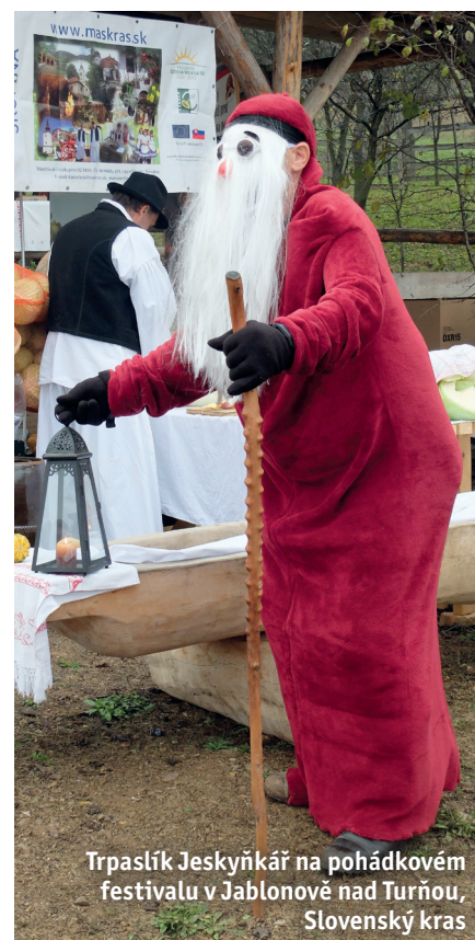
Trpaslík Jeskyňkář na pohádkovém festivalu v Jablonově nad Turňou, Slovenský kras

„Freiburská čtvrť Vauban je příkladem plánování a budování no-