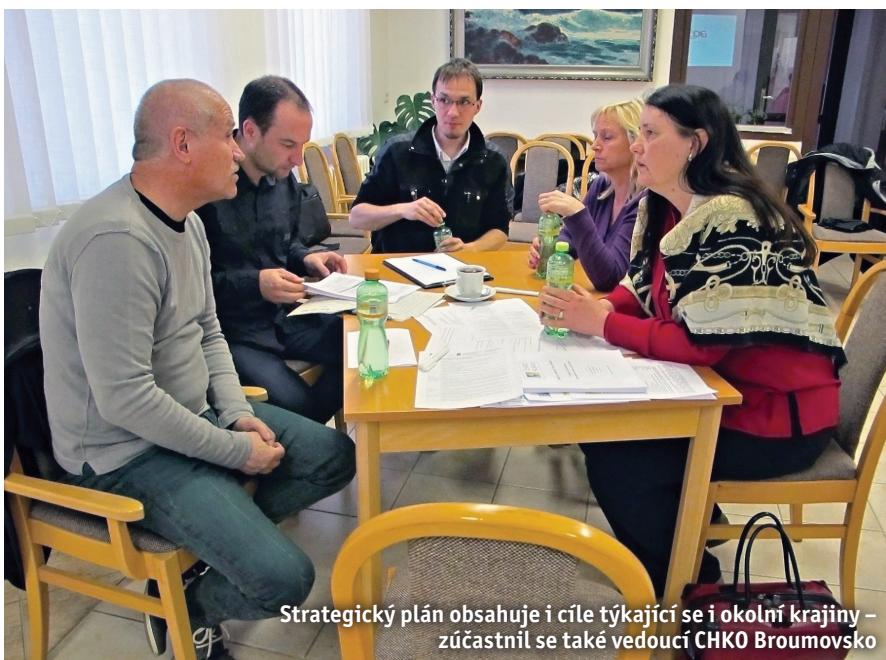
Strategický plán obsahuje i cíle týkající se i okolí krajiny – zúčastnil se také vedoucí CHKO Broumovsko