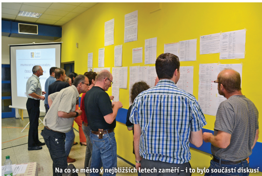
Na co se město v nejbližších letech zaměří – i to bylo součástí diskusí

pro dobré fungování strategického plánu se ukázalo rozhodnutí o vytvoření pracovní pozice, která zastřešuje jeho administrativu.