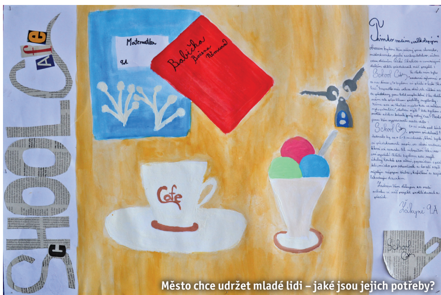
Město chce udržet mladé lidi – jaké jsou jejich potřeby?

Zastupitelé do plánu vstupují velmi aktivně a vnímají ho jako usnadnění svého mandátu, protože znají vizi i konkrétní cíle. Občané vidí v plánu prostředek kontroly, zda jsou naplňovány jednotlivé cíle. Aktivitu spojené se zlepšením komunikace, spolupráce a podpory neziskových organizací, kterých v našem městě funguje velké množství, lze bez problému prohlásit za zlepšené. K tomu přispěl právě proces zpracování