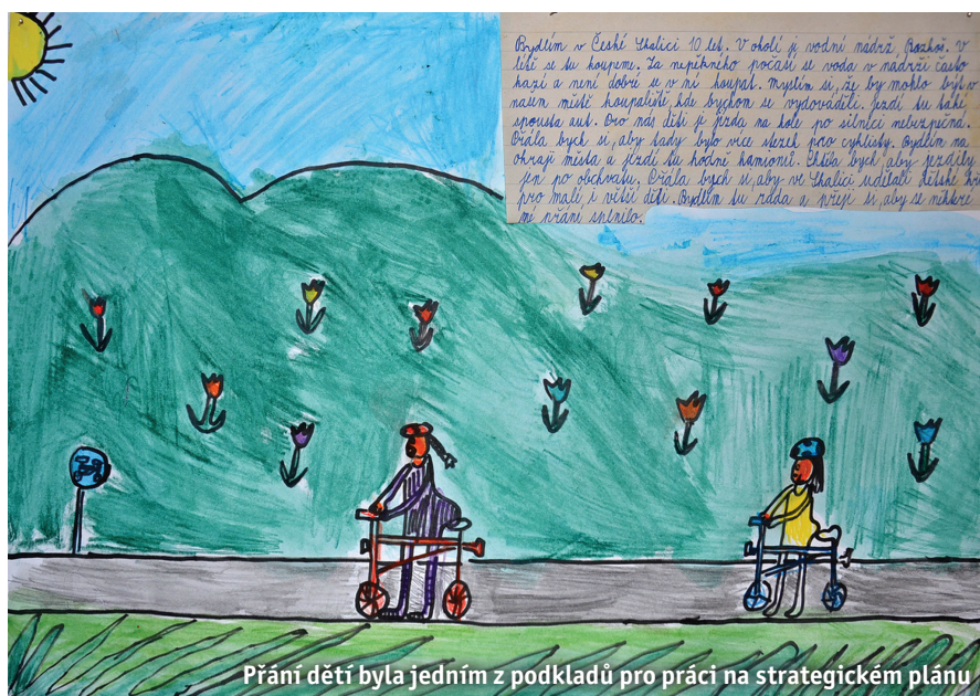
Přání dětí byla jedním z podkladů pro práci na strategickém plánu

PhDr. Alena Bauerová je samostatnou konzultantkou pro strategické plánování a zapojování veřejnosti.