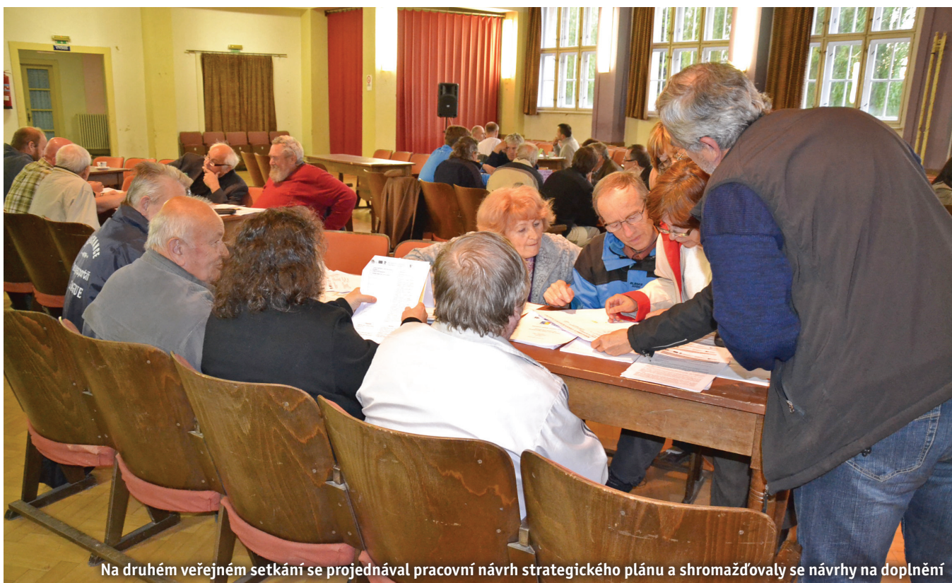
Na druhém veřejném setkání se projednával pracovní návrh strategického plánu a shromažďovaly se návrhy na doplnění

Již při zpracování plánu došlo k zapojení většiny pracovníků úřadu do jeho přípravy. Protože mohli sami ovlivňovat jeho tvorbu, je pro ně naplňování svěřených cílů tím závaznějším. Hlavním úkolem pro zaměstnance je zapojení do tvoření a plnění akčních plánů schválených zastupitelstvem. Za tvorbu a předkládání vyhodnocení zastupitelům obce, kteří cíle sledují, na našem úřadě zodpovídá přímo tajemník. Jako klíčové