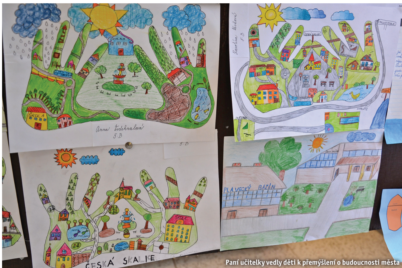
Paní učitelky vedly děti k přemýšlení o budoucnosti města

Přijetím strategického plánu zastupitelstvem města Česká Skalice v červnu 2014 začala pilotní fáze uplatnění plánu v praxi řízení města. Byl zpracován první akční plán na rok 2014 a posléze na rok 2015, do něhož se soustředil přehled konkrétních projektů a úkolů rozpracovaných v návaznosti na rozpočet města a naplňujících stanovené cíle. V průběhu této pilotní fáze byla již také realizována řada kroků a aktivit, jež naplňují nebo začaly naplňovat stanovené konkrétní cíle. Souhrn zkušeností z pilotní fáze vedl k aktualizaci některých cílů. Návrhy na aktualizaci projednala řídicí skupina v novém složení, které reflektovalo výsledky komunálních voleb z října 2014.