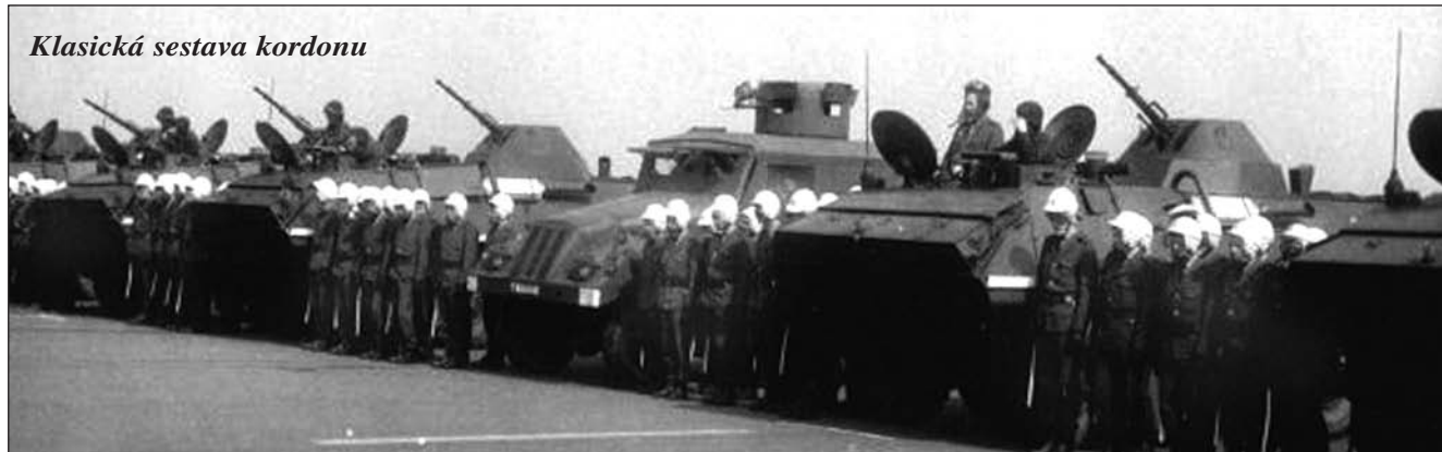
Klasická sestava kordonu