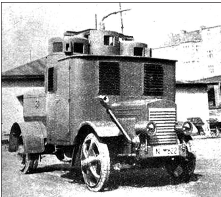
Fotografie prvního vodního stříkače – 1931

Vznikl začátkem 20. let a byla to velmi slibná konstrukce. Nejednalo se o opancéřovaný nákladní automobil, čtyřkolový podvozek byl konstruován samostatně. Vůz byl říditelný v obou směrech, na silničních kolech s pneumatikami prý na silnici dosahoval rychlosti až 70 km/h. Tato kola bylo možno vyměnit za kola s plnými pryžovými obručemi – s nimi byl vůz sice pomalejší, ale zato byl méně zranitelný střelami. Osádce pěti mužů chránila pancéřová nástavba, v jejíž rozích byly v kulových lafetách uchyceny čtyři těžké vodou chlazené kulomety Maxim 08. Pancéřová karoserie nesla maskovací nátěr v kombinaci hnědé, zelené a okrové barvy. Československá armáda je používala, zkoušela a předváděla na přehlídkách. Vojenské označení mělo být OA vz. 23, ale k oficiálnímu zavedení do výzbroje nedošlo. Nevýhodou byl shledán sice účelný, ale výrobně nákladný pancíř, nedostatečný výhled řidiče a stísněný vnitřní prostor s ohledem na výzbroj.