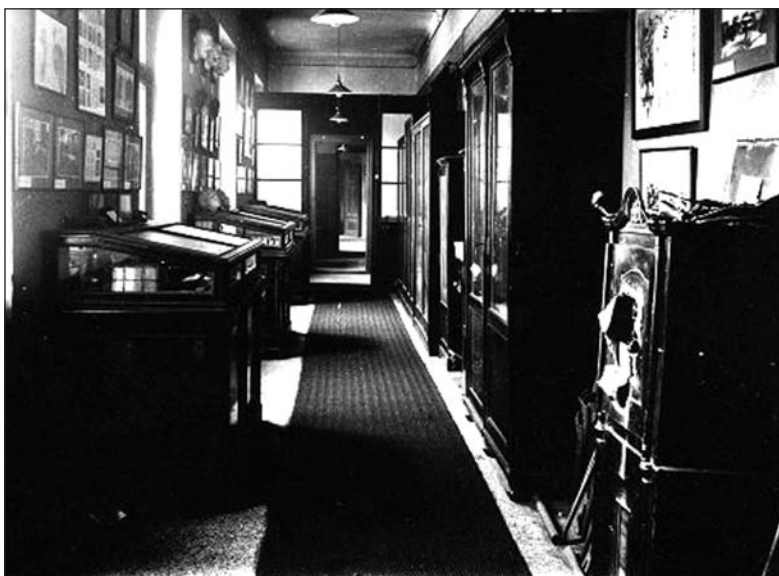
Kriminologický ústav při Právnické fakultě Univerzity Karlovy v Praze (?), 20–30 léta 20. století

jejich činnosti a používaných nástrojů). 19) Uvedené má svůj význam především proto, že obdobné cíle jsou většinou uváděny u všech nově otvíraných zařízení tohoto typu a nebylo tomu jinak ani v roce 1954 při zpřístupnění Kriminalistického kabinetu.