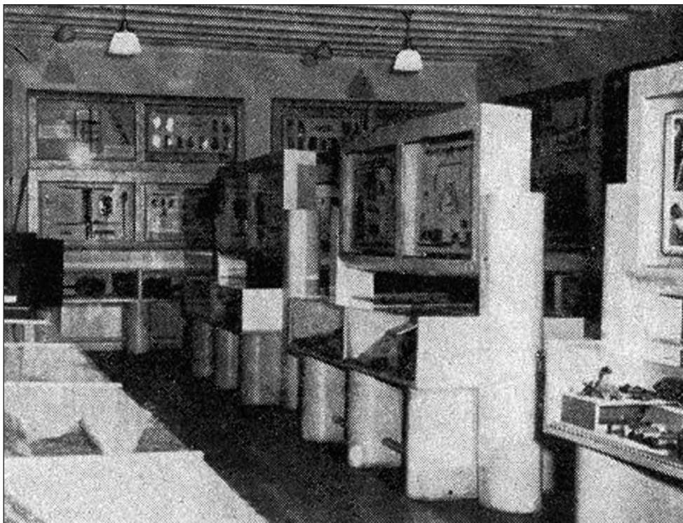
Kriminalistický kabinet – sál pro prezentaci majetkových deliktů, 1964