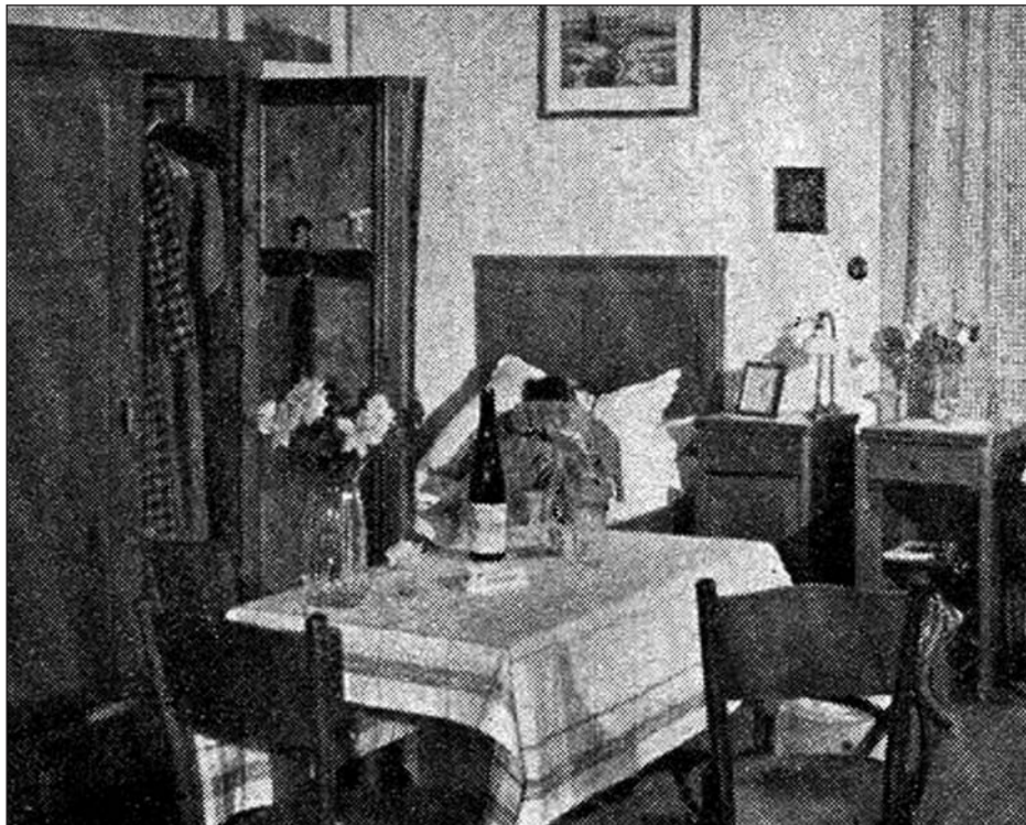
Kriminalistický kabinet – místo činu, 1964