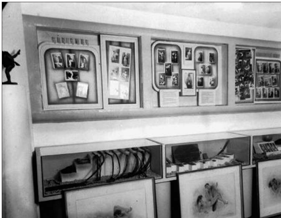
„Muzeum pornografie“ při Kriminalistickém ústavu, 1954 (?)