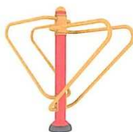
Bradla - 4.