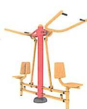
Váha – 1.