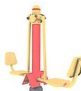
Zdvihací zařízení – 3.