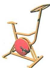
Kolo – 2.