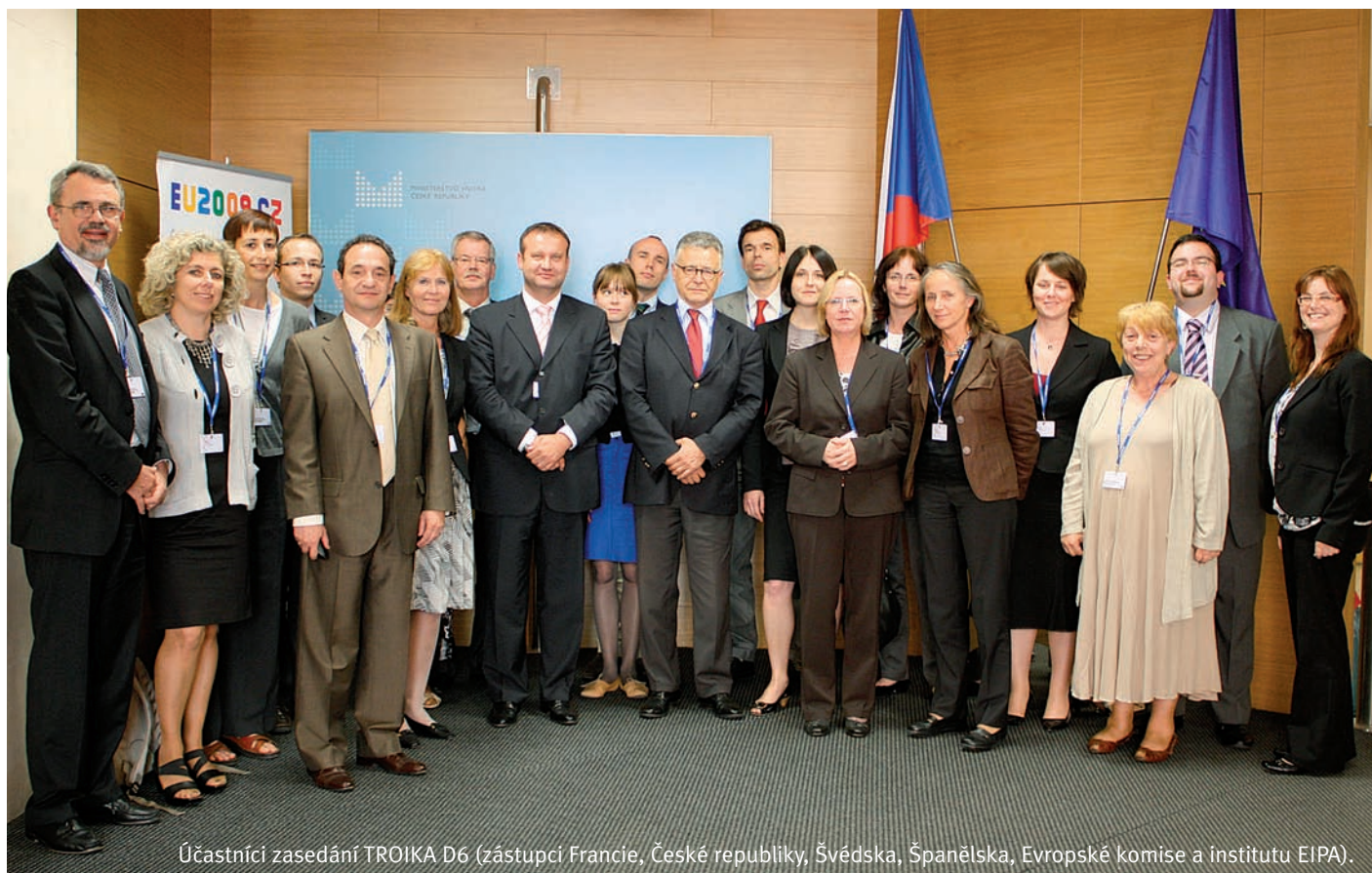
Účastníci zasedání TROIKA D6 (zástupci Francie, České republiky, Švédska, Španělska, Evropské komise a institutu EIPA).