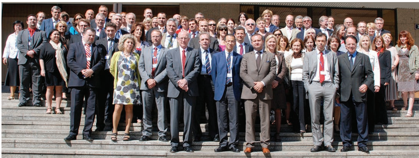
52. setkání generálních ředitelů veřejné správy sítě EUPAN

ní sítě EUPAN, tzv. Troika DG (zástupci Francie, České republiky, Švédska, Španělska, Evropské komise a institutu EIPA). Na tomto jednání byly představeny hlavní výsledky českého předsednictví, schválil se text rezolucí jednotlivých pracovních skupin i program samotného jednání 52. setkání generálních ředitelů.