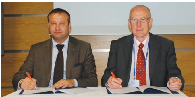
Vrchní ředitel Sekce veřejné správy MV ČR PhDr. Robert Ledvinka a prezident EPSU Charles Cochrane při podpisu Závěrů pracovní skupiny k sociálnímu dialogu.

V rámci portugalského předsednictví (prosinec 2007) byl schválen Střednědobý program generálních ředitelů veřejné správy členských zemí EU na léta 2008 - 2009 a schválena dvouletá testovací fáze implementace sociálního dialogu do ústřední veřejné správy v zemích EU – úzká spolupráce evropských odborů pracovníků veřejných správ (TUNED – Trade Unions' National and European Administration Delegation – Evropská odborová unie) s EUPAN.