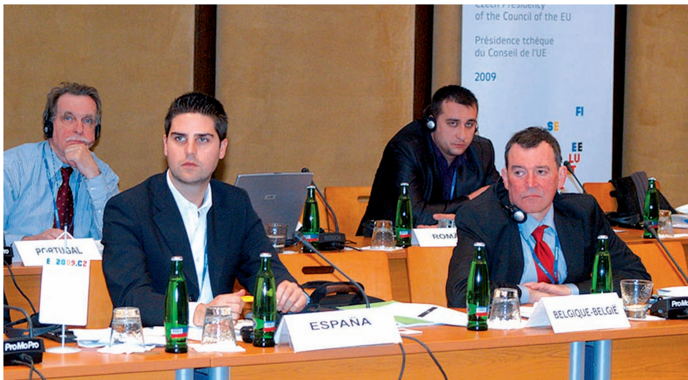
Účastníci konference sociálního dialogu

Neformální síť v oblasti veřejné správy funguje už od 70. let. V roce 1981 byla zřízena EIPA (European Institute for Public Administration), jejíž role spočívá zejména v podporování, koordinaci a vytváření studií, konferencí, seminářů a workshopů k otázkám všech aspektů veřejné správy pro země Evropské unie. V roce 2001 byla spuštěna CIRCA (Communication and Information Resource Center Administrator - Správce střediska komunikačních a informačních zdrojů), tj. webové rozhraní pro sdílení dokumentů EUPANu.