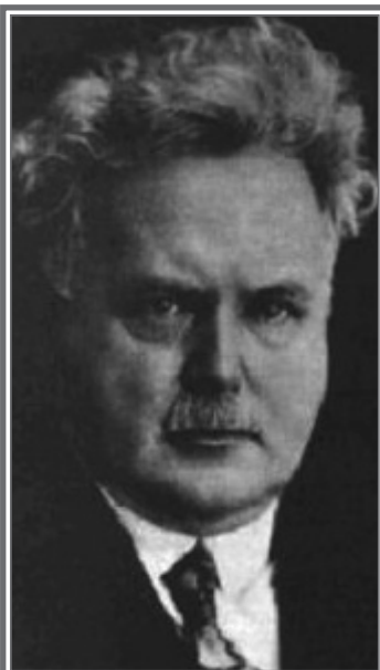
„Všude se sleduje,“ vyčítá Masarykovi Viktor Dyk ve svém známém díle „Aad usum pana prezidenta republiky“ z roku 1929. Jednalo se o paranpii rozjitřené umělecké duše nebo o reflexi politické kultury vytvářené muži kolem prezidenta Masaryka?

Uniformované i neuniformované Sbory strážce bezpečnosti působily u úřadu, u něhož byly zřízeny, avšak části sboru nebo jednotliví členové mohli být k výkonu služby přikázáni k jinému úřadu. Působnost mezi oběma sbory byla vymezena následujícím způsobem. Uniformované strážce dle nařízení konají hlídky, pochůzky, eskortují a hlídají vězně, poskytují první pomoc, konají služby telegrafické a telefonní. Neuniformované strážce vykonávají služby zpravodajskou, vyšetřovací, dohlédací, pátrací a kancelářskou. Zpravodajskou službou se rozumí pozorování a hlášení všech událostí, které jsou významné pro veřejný pořádek, pokoj a bezpečnost. Vyšetřovací službou se rozumělo na příkaz konané vyšetřování a vyhledávání v zájmu služby, dohlédací službou dohlédání na osoby, podniky, jež by