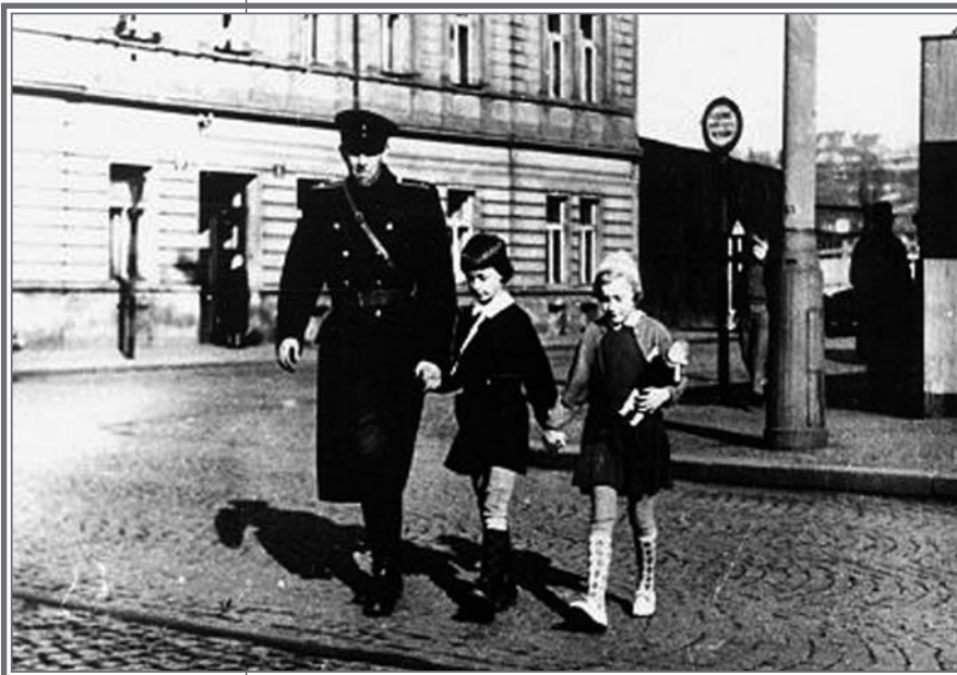
Směrnice přikazovala okrskovým zmocněncům spolupracovat i s pionýry.

VIFS tyto zprávy předávalo v autentickém znění OBZ příslušné úrovně a dále zemskému finančnímu ředitelství. Styčný důstojník a zemské finanční ředitelství využívali poté tyto zprávy dle příkazu svých nadřízených. U každé zprávy bylo nutné