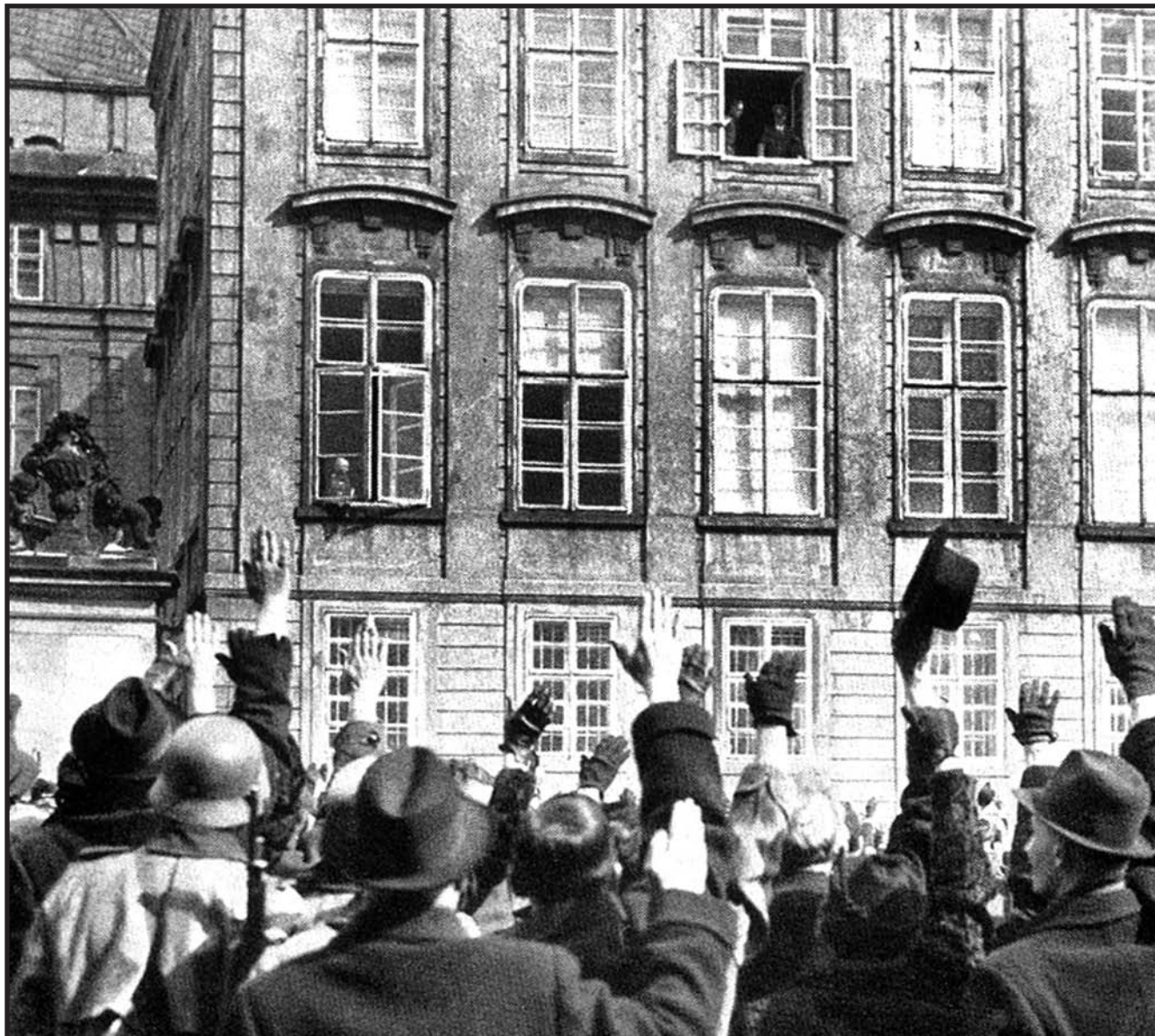
Už zbývaly jen hodiny k vrcholu ponížení: Adolf Hitler na Hradčanech – a urážlivou češtinou sepsaná vyhláška generála Blaskowitze (viz s. 15)

před hodinou sem telefonicky volali kolegové z Ostravy: „Loučíme se s vámi, německé tanky jsou v dohledu. Nevíme, co s námi bude, kdy se zase budeme moci ozvat, ozveme-li se vůbec.“