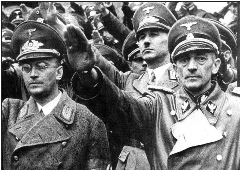
V protektorátu patřil k nejmocnějším mužům karlovarský rodák Karl Hermann Frank (vpravo), na sudetském území vládl Konrad Henlein (vlevo), který pocházel z Liberce