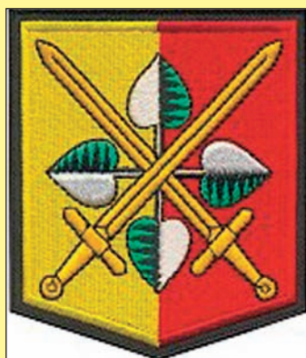
Správa hl. m. Prahy