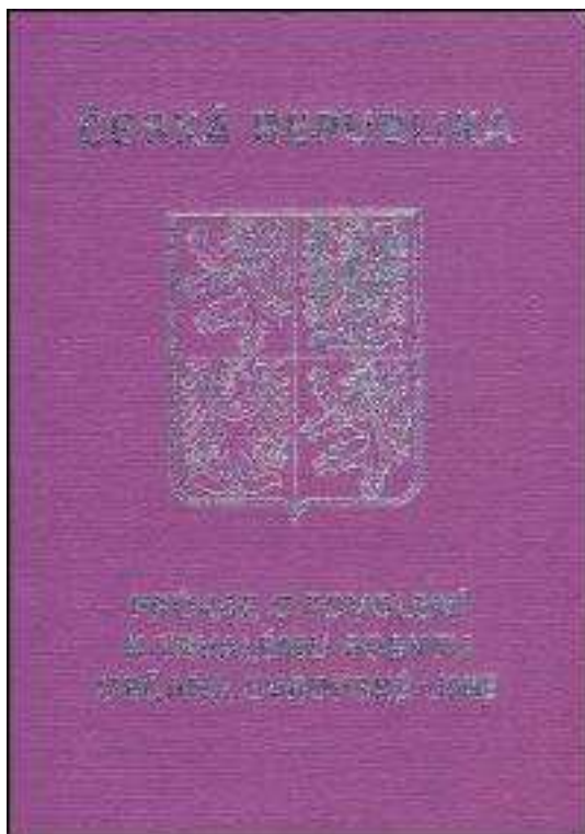
Obr. 7. Průkaz o povolení k trvalému pobytu občana EU.

Veřejná listina vydávaná v minulosti občanům Evropské unie, a to s dobou platnosti na deset let. V současné době již tento typ doklad není vydáván. Tyto doklady nicméně zůstávaly v oběhu, a to až do konce v nich uvedené doby platnosti.