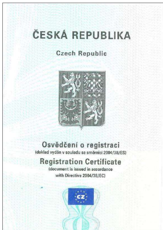
Obr. 1. Vzor osvědčení o registraci.

V současné době je na všech pracovištích odboru azylové a migrační politiky Ministerstva vnitra dostupný nový vzor dokladu. Všechny nově vydané doklady jsou již nyní ve formě osvědčení o registraci a neobsahují razítko, že se jedná o tento druh dokladu.