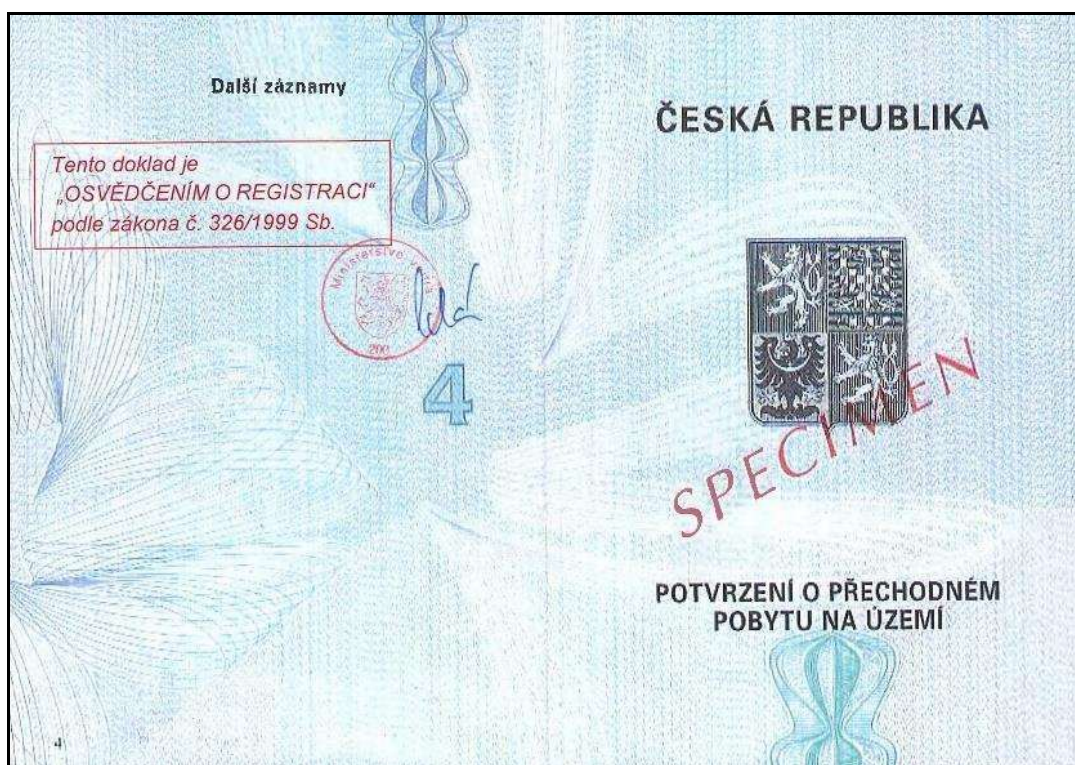
Obr. 2. Potvrzení o přechodném pobytu na území.

Potvrzení o přechodném pobytu na území bylo původně vydáváno s neomezenou dobou platnosti. S nabytím účinnosti zákona č. 176/2019 Sb., kterým se mění zákon č. 326/1999 Sb., o pobytu cizinců na území České republiky a o změně některých zákonů, ve znění pozdějších předpisů, a další související zákony, však byla platnost vydaných potvrzení o přechodném pobytu na území omezena. Ode dne 31. 7. 2019 tak platí, že potvrzení o přechodném pobytu na území České republiky pozbývá platnosti uplynutím deseti let ode dne vydání . Potvrzení o přechodném pobytu vydaná přede dnem 1. 1. 2010 pozbyla platnosti uplynutím dne 31. 12. 2019.