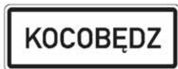
IS 12c Obec v jazyce národnostní menšiny

19. V příloze č. 3 bodu 5 písmeni b) se mění vyobrazení značek „IS 12c Obec v jazyce národnostní menšiny“ a „IS 12d Konec obce v jazyce národnostní menšiny“.