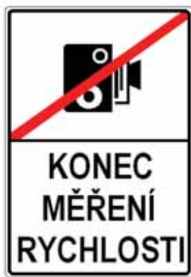
IP 31b Konec měření rychlosti

19. V příloze č. 3 bodu 5 písmeni b) se mění vyobrazení značek „IS 12c Obec v jazyce národnostní menšiny“ a „IS 12d Konec obce v jazyce národnostní menšiny“.