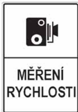
IP 31a Měření rychlosti

18. V příloze č. 3 bodu 5 písmeni a) se doplňují vyobrazení a názvy značek „IP 31a Měření rychlosti“ a „IP 31b Konec měření rychlosti“.