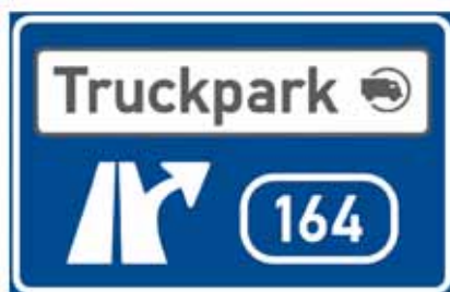
IJ 17a Truckpark