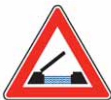
A 33 Pohyblivý most

17. V příloze č. 3 bodu 1 se doplňuje vyobrazení a název značky „A 33 Pohyblivý most“.