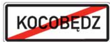
IS 12d Konec obce v jazyce národnostní menšiny

20. V příloze č. 3 bodu 5 písmeni c) se doplňuje vyobrazení a název značek „IJ 16 Silniční kaple“, „IJ 17a Truckpark“ a „IJ 17b Truckpark“.