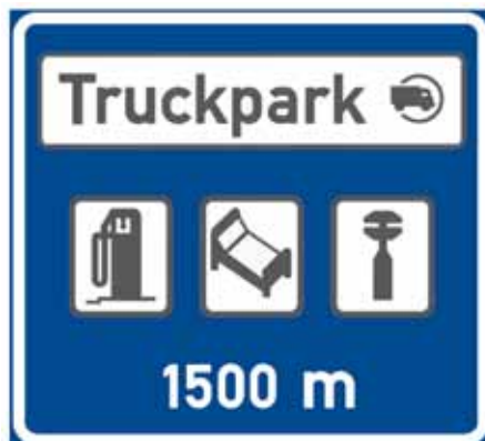
IJ 17b Truckpark

21. V příloze č. 3 bodu 6 se doplňuje vyobrazení a název značky „E 12 Jízda cyklistů v protisměru“.