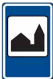
IJ 16 Silniční kaple

20. V příloze č. 3 bodu 5 písmeni c) se doplňuje vyobrazení a název značek „IJ 16 Silniční kaple“, „IJ 17a Truckpark“ a „IJ 17b Truckpark“.