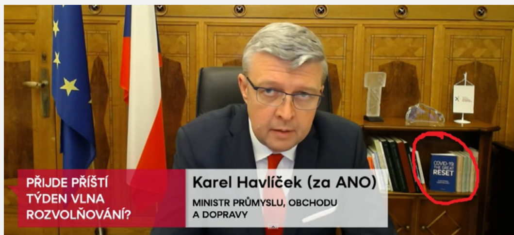
Schwabova kniha Covid-19: Velký reset byla na screenshot dodána pomocí Photoshopu.

Zde už také narážíme na zřetelný politický podtext. Zatímco obecně apokalyptické teorie jsou zpravidla neutrální, ztotožňování EU s New World Order, případně velebení čínského a ruského režimu za domnělou ochranu před iluminátskou totalitou či depopulací Země, je v rozborech Velkého resetu dosti časté. Proniklo i do českých řetězových emailů, kde byl ze spoluúčasti na spiknutí obviněn ministr K. Havlíček. Ve své době šlo o jeden z nejčastěji šířených hoaxů.