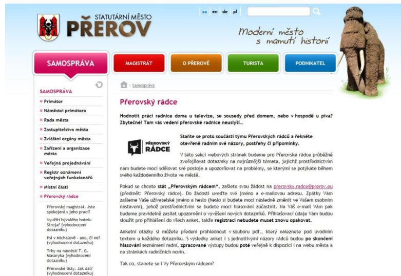
Přerovský rádce na webu města