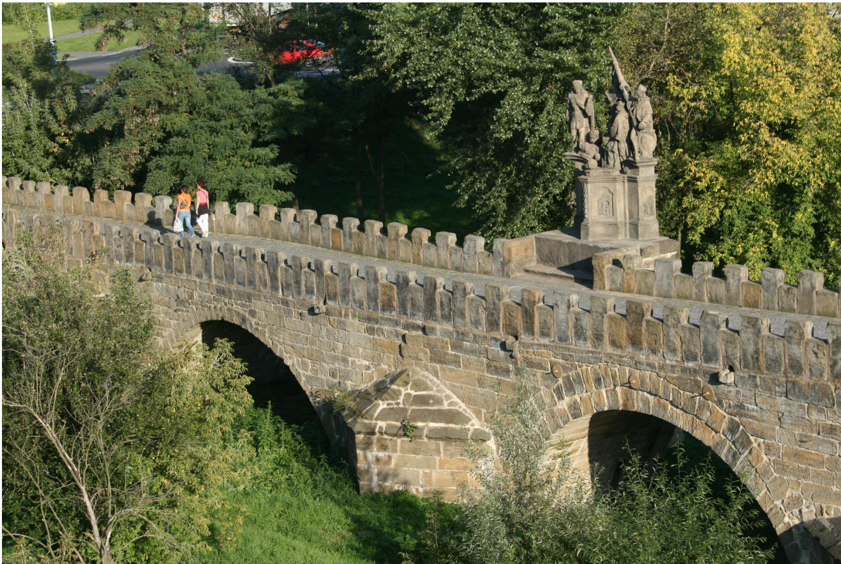
Staroměstský most přes Ploučnici