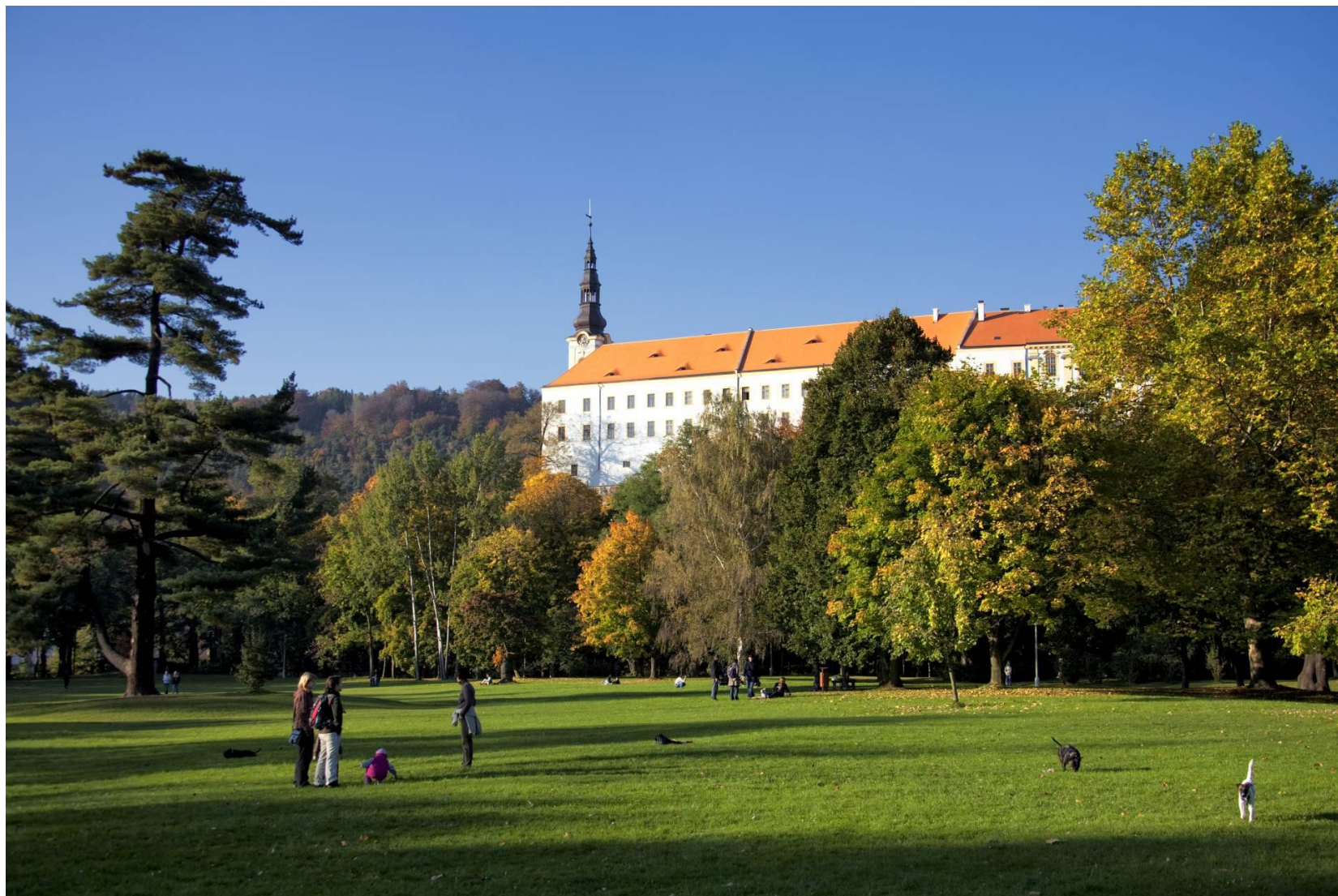
Děčínský zámek a Mariánská louka