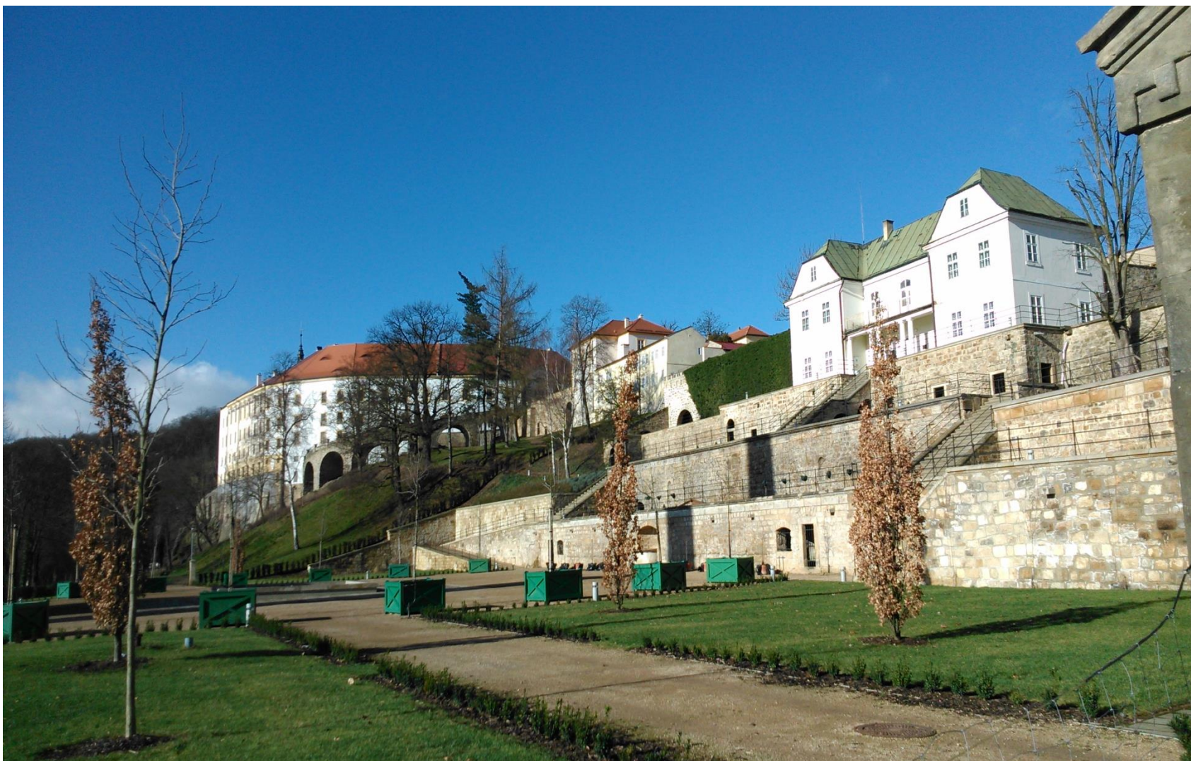
Jižní zahrady Děčínského zámku