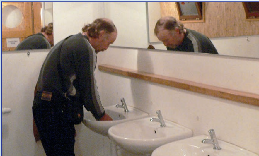
Sociální zařízení je i přes stísněné lodní prostory vybavené zvlášť pro ženy a zvlášť pro muže, teplá voda je samozřejmostí