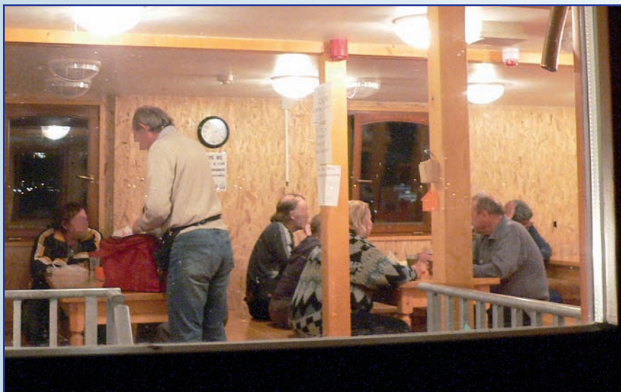
Pohled do jídelny lodi zvenku napovídá o příjemně strávené hodině před spaním s lidmi stíženými stejným osudem

kteřá je zároveň vedoucí oddělení služeb pro osoby bez přístřeší.